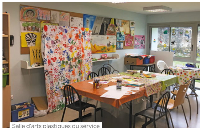
Salle d'arts plastiques du service

Clinique FSEF Aire-sur-l'Adour 2 rue de Prat - 40800 Aire-sur-l'Adour (par fax au service médical au : 05 58 71 77 03 ou par téléphone au : 05 58 71 65 08)