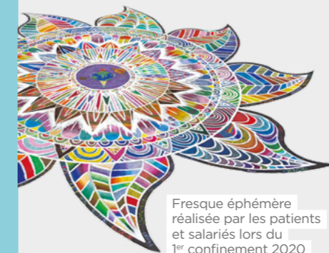
Fresque éphémère réalisée par les patients et salariés lors du 1 er confinement 2020