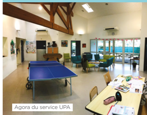
Agora du service UPA