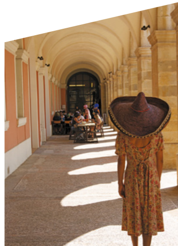
Photo prise dans le cadre du projet Culture et Santé 2019

disposant de ce type de prise en charge singulière, la Clinique propose une offre thérapeutique et pédagogique novatrice incluant la dimension sociale et socio-culturelle portée par notre service Animation. Celui-ci proposant des activités de création individuelle et d'expression collective (théâtre, arts plastiques, cirque, musique, ...).